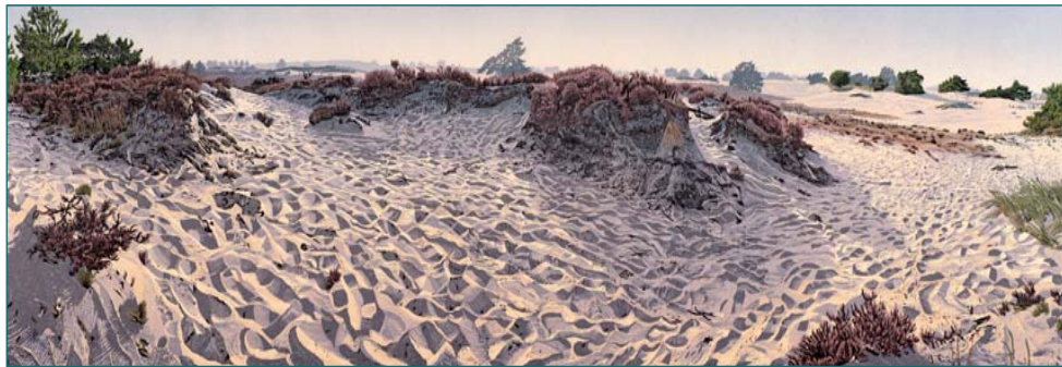
Rekinger Zand, 2020, Farbholzschnitt , 46 x 100 cm