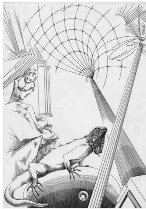
„Nachricht vom Wandel“, 34,5x25 cm

Wer ist uns über die Horizontlinie getrippelt getrappelt wer hat sie uns abgebrochen in Stücke gemetert zu Spaghetti gekocht geraspelt verbogen der schöne Horizont vergeblich geleimt ging durch uns durch hinterm Blick feld das Schöne Fremde denkbar fliegt in kurzen Strichen spitz findig um unser Ohr und geht mit erfolgter Sprengung laut los lass uns Mikado spielen KUK 15